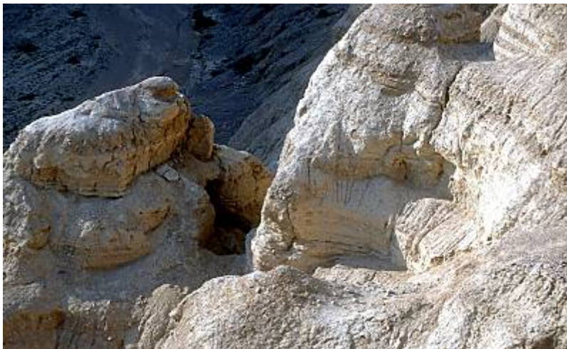
Caverna 7 (  direita), 8 (  esquerda)

Todo material achado na Caverna 7 estava em Grego. A caverna desmoronou logo ap s os rolos terem sido escondidos.