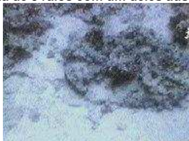
Notar a semelhança com um carro egípcio da época.